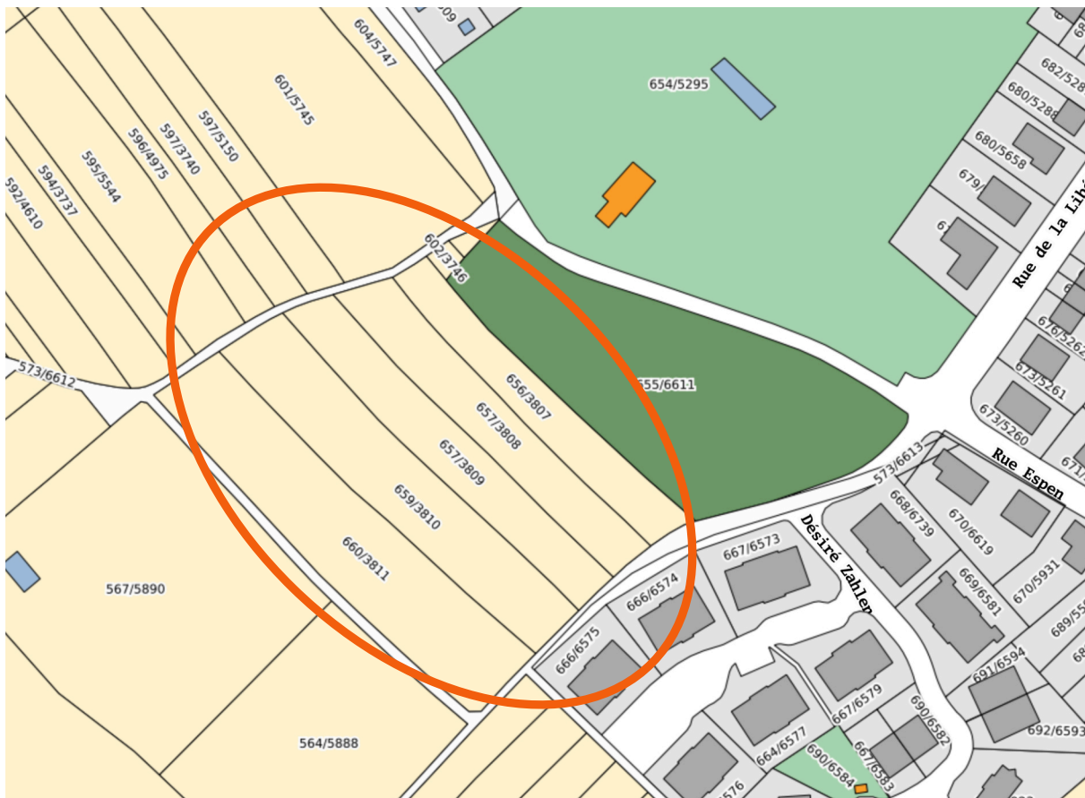
Figure 1 - Extrait du plan cadastral