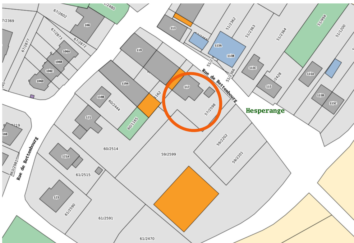
Figure 1 - Extrait du plan cadastral